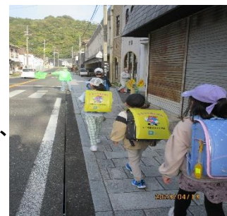
新1年生初日の登校

登下校の際は、防犯ふれあい隊の皆様やPTAの方々が交通指導や挨拶立番をして下さいます。ピカピカの1年生と、2年生以上のお兄さん、お姉さんを含め、校区内の皆様の見守り、お声かけを宜しくお願い致します。