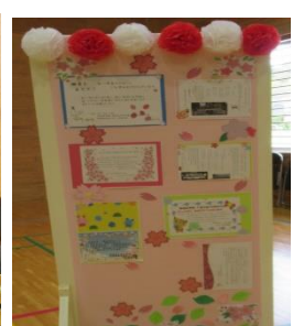
町副町長 福田政美様からの祝辞 PTA会長 花田宇利様からの祝辞 児童代表 花田くんの言葉 各園からの祝辞、感謝!